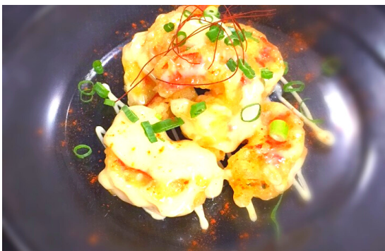
店主おすすめ 海老のマヨネーズ和え