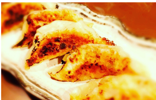
店主おすすめ 自家製餃子