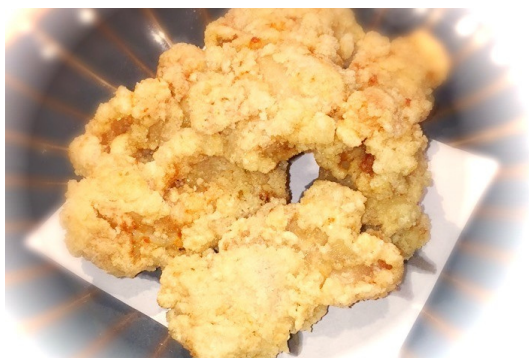
一番人気 特製塩ザンギ